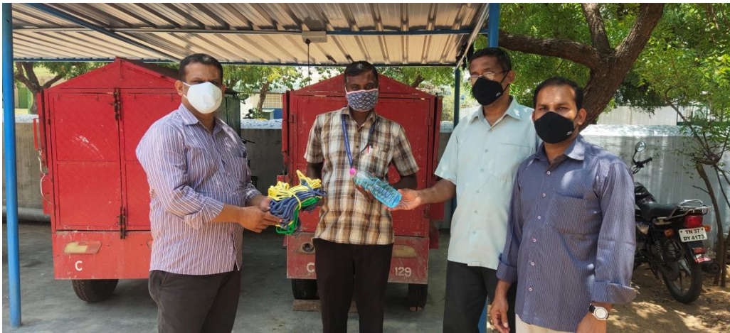
Donated Face masks, Hand sanitizers and Hand wash soap solutions for the Panchayat office at Rasipalayam village