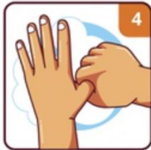
CLEAN YOUR THUMBS