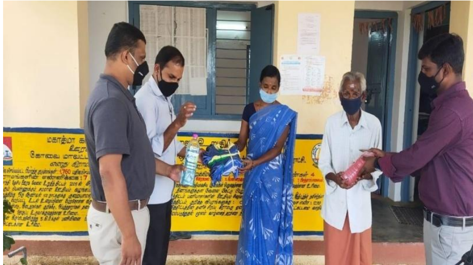
Care for the Public event at Kaduvettipalayam Village