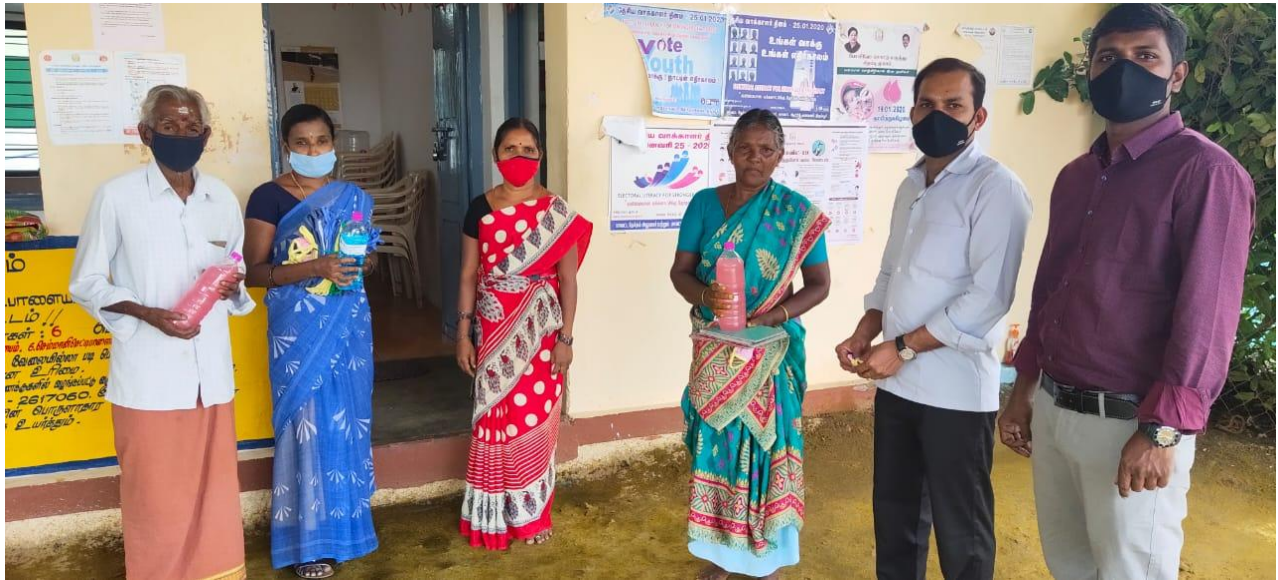
Donated Face masks, Hand sanitizers and Hand wash soap solutions for the Sanitary workers at Masagoundenchettipalayam village