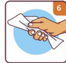
DRY WITH TOWEL