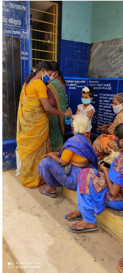
Donated Face masks, Hand sanitizers and Hand wash soap solutions for the Ration shop and public at Rasipalayam village