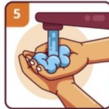
RINSE YOUR HANDS