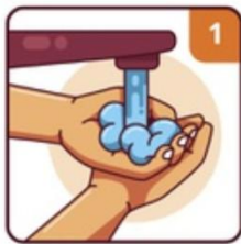
WET YOUR HANDS