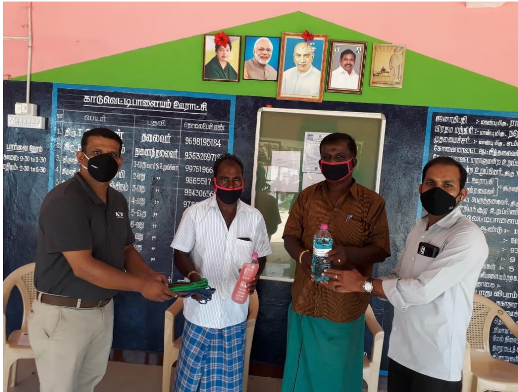
Donated Face masks, Hand sanitizers and Hand wash soap solutions for the Panchayat office at Kaduvettipalayam village