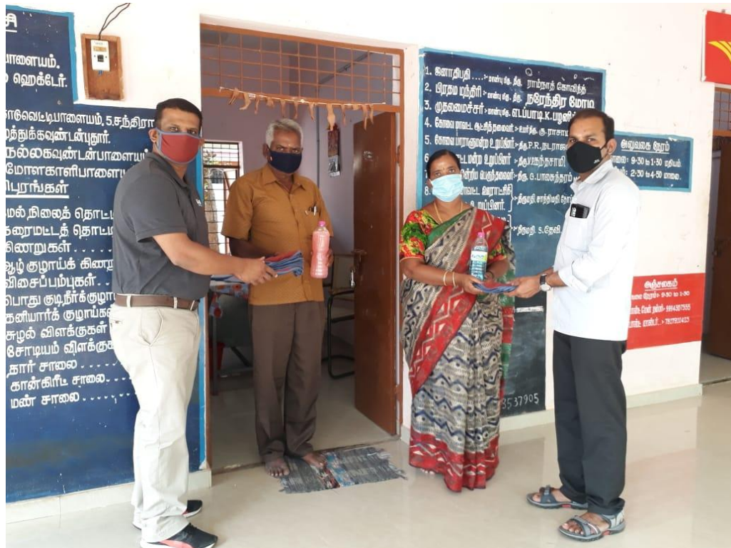
Donated Face masks, Hand sanitizers and Hand wash soap solutions for the Village officers office at Kaduvettipalayam village