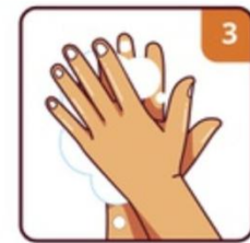
SCRUB YOUR HANDS