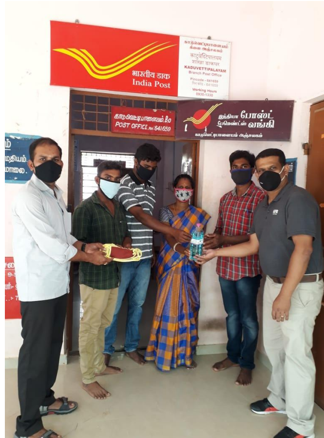
Donated Face masks, Hand sanitizers and Hand wash soap solutions for the Post office at Kaduvettipalayam village