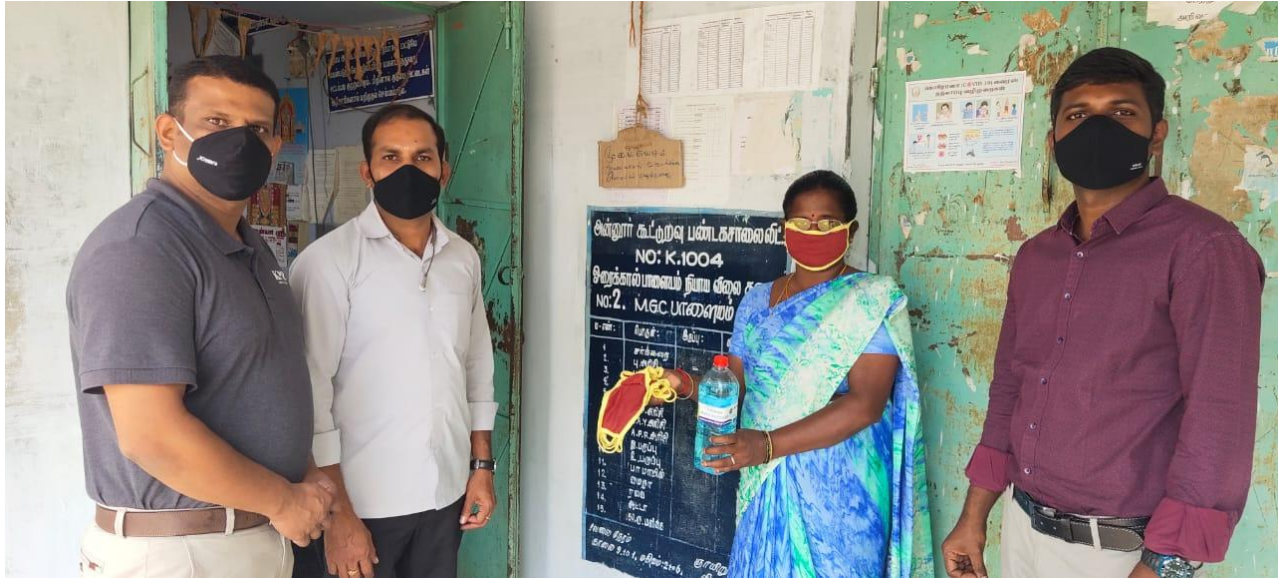
Donated Face masks, Hand sanitizers and Hand wash soap solutions for the Ration shop at Masagoundenchettipalayam village